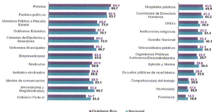
Percepción sobre la frecuencia de corrupción en diversos sectores (muy frecuente o frecuente, porcentaje)

En el estado de Quintana Roo, 88.9% de la población de 18 años y más percibió que la corrupción es una práctica muy frecuente o frecuente en los policías , seguido de los partidos políticos con 82.9 por ciento.