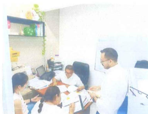
Instituto de Economía Social y Solidaria (IESSOL)