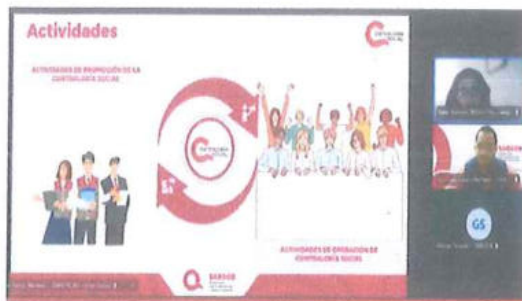
Fundación Integración para la Vida (INPAVI)