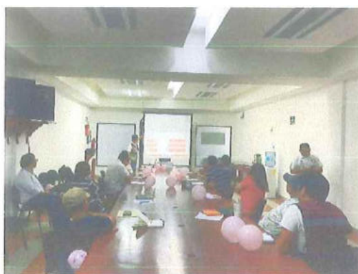
Secretaría de Desarrollo Agropecuario, Rural y Pesca (SEDARPE)

Nota: Las fotografías incluidas en este medio de verificación son representativas de las acciones realizadas.