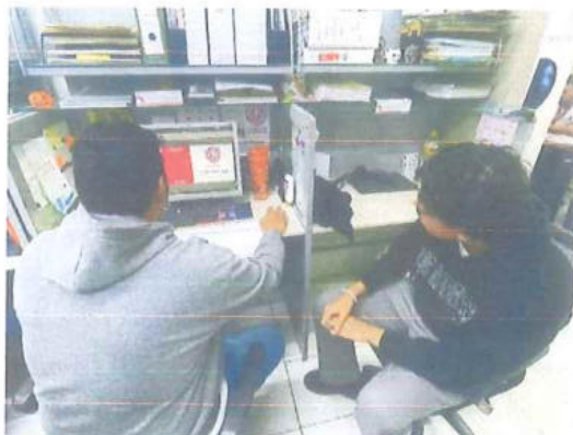
Centro De Bachillerato Tecnológico Industrial y de Servicios Núm. 253