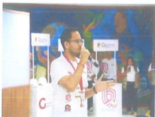
Instituto Tecnológico de Chetumal (ITCH)