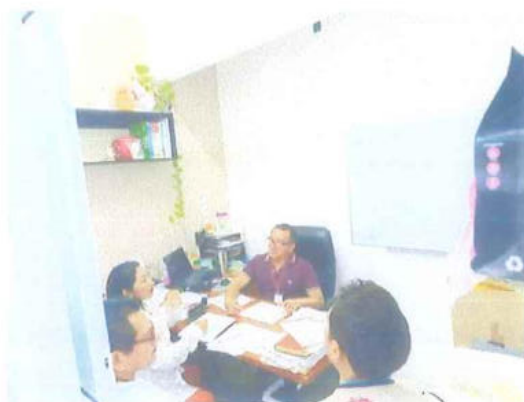
Secretaría de Bienestar (SEBIEN)