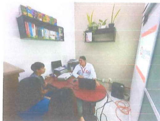
Colegio Nacional de Educación Profesional Técnica (CONALEP)- (2) Centro De Bachillerato Tecnológico Industrial y de Servicios Núm. 253 - (1)