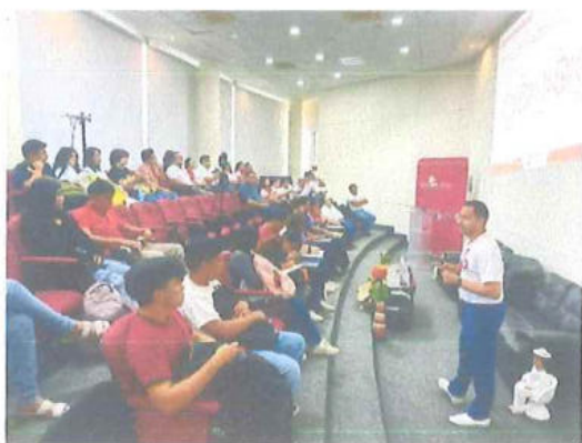
Universidad Intercultural Maya de Quintana Roo (UIMQROO)