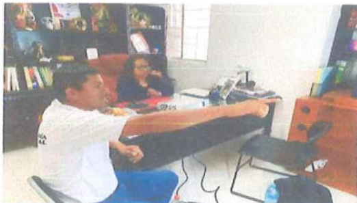
Baal Aantik Yook'ol Kab A.C.

Nota: Las fotografías incluidas en este medio de verificación son representativas de las acciones realizadas.