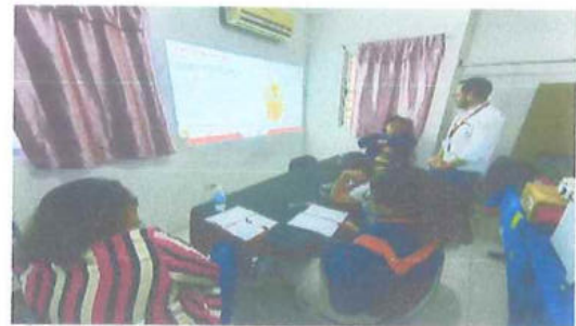
Pok Ta Pok A.C.