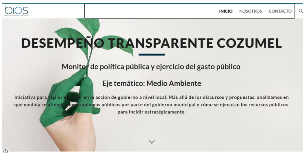
Inicio de la plataforma del proyecto Desempeño Transparente

Esta propuesta innova en tanto que genera una metodología propia, con rigor analítico, que retoma elementos estratégicos en materia de transparencia y desempeño de la política pública ambiental. Si bien esta es una innovación técnica, tal vez aun más valiosa en la propuesta social: esta metodología cuantifica a través de una calificación (que se desprende de dos índices) la consistencia de la política ambiental para poder hacer de comprensión simple y directa a la ciudadanía de Cozumel qué tan buenos resultados en materia de desempeño puede dar esta. Todo este proceso de “traducción” del lenguaje técnico al lenguaje común se acompaña de una plataforma llena de recursos visuales (palomitas, taches, caritas felices, semáforos, etc.) y capacitaciones para que, las personas interesadas, puedan comprender y hacer uso de estas herramientas de información pública y, de hoy en adelante, tengan la posibilidad de acompañar ejercicios de contraloría social como éste, que se traducen en agendas puntuales, técnicamente viables y con un plan de incidencia que se presentará ante las autoridades locales.