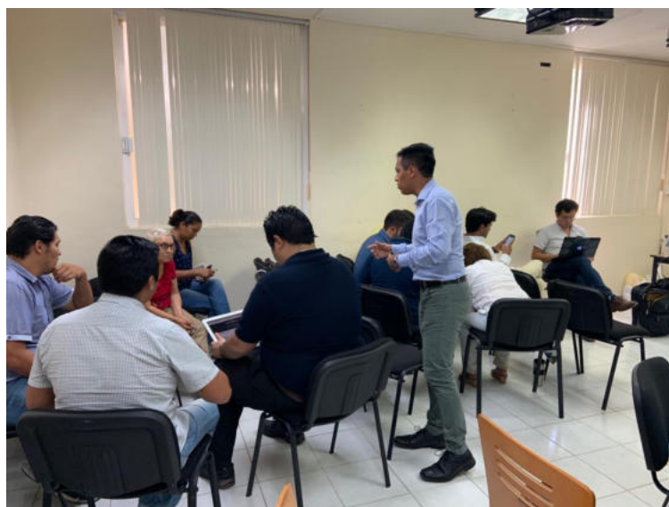
Primera edición del Taller Monitor Desempeño Transparente, en el municipio de Cozumel, Quintana Roo.

Posterior a la validación de los temas, se impartirá el Taller Monitor Desempeño Transparente, en el que se invita a miembros de sociedad civil local, periodistas, académicos y en general a toda la población interesada en la contraloría social y en la temática medioambiental, para explicarles cómo usar la plataforma, capacitarlos en los temas citados (y algunos más sugeridos por la misma sociedad civil en los meses siguientes) y generar una agenda para presentarla al gobierno local, de forma que sus resultados puedan ser tomados en cuenta para el siguiente ciclo presupuestario -este ejercicio de implementación de talleres se espera realizar en el mes de noviembre-. El resultado último de este ejercicio, además del fortalecimiento de las capacidades de contraloría social, es generar un Plan de mejora, es decir, un plan de incidencia con las áreas de mejora que se observen gracias a este ejercicio y a lo que sociedad civil pueda proponer para ser llevado al gobierno municipal como una propuesta técnicamente viable de implementar y avalada por el conglomerado de personas participantes del proyecto y las capacitaciones.