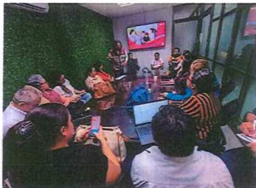
Servicios Educativos de Quintana Roo (SEQ)