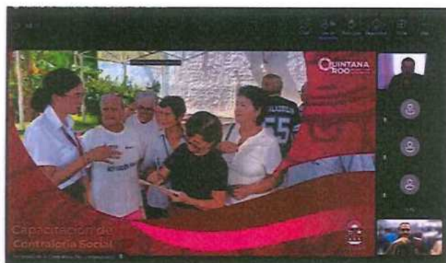
Secretaría del Bienestar (SEBIEN)