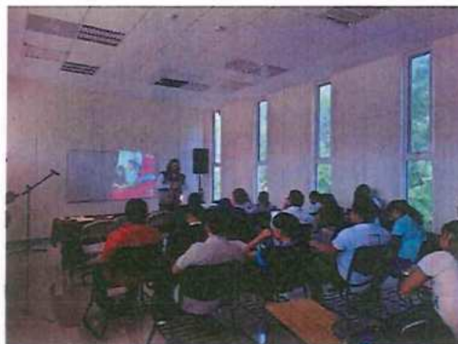
Universidad Intercultural Maya de Quintana Roo (UIMQROO)