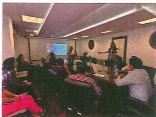
Secretaría de Obras Públicas (SEOP)